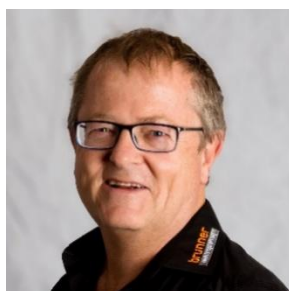
Ketch Sonderegger Elektroplaner